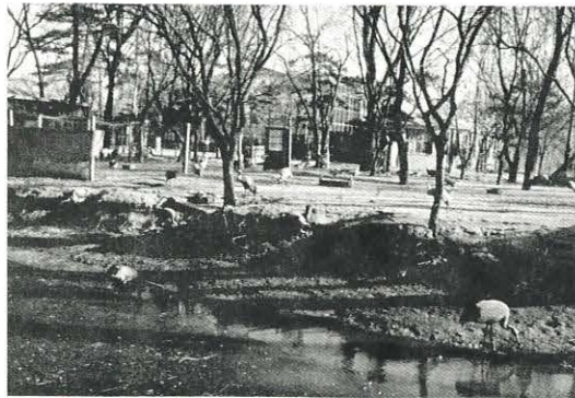
北京動物園

を越える入園者となったが、それだけに市民の情操教育、憩いの場としてふさわしい動物園に、整備せねばならない。動物の充実はもちろんであるが、動物園を含む天王寺公園一帯を、都心の大切な空間であるので、よりよく計画的に整備を進めてもらいたい。