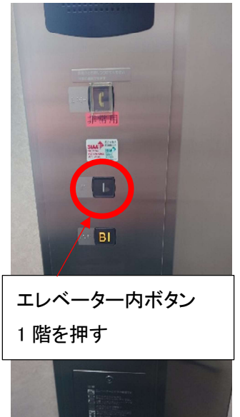
エレベーター内ボタン 1階を押す