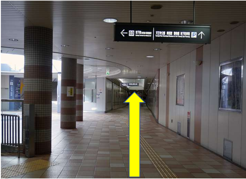
6. 駐車場入り口手前、左側に、エレベーターがあります