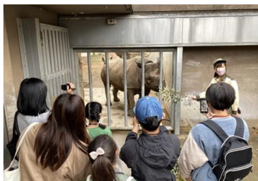
<イベントイメージ(前回開催時の様子)>

本イベントは、関西全域のコミュニティチャンネル「J:COMチャンネル」(地デジ11ch)で放送中の、天王寺動物園応援番組『てんのうじどうぶつえんのZOOっとテレビ』のスペシャル企画です。番組がめざす「いのちの尊さ」「地球環境の保全」について考えるきっかけづくりの場を、動物園の中で提供します。「ひとつにも動物にもやさしい1日に」をイベントテーマに、イベント参加者がSDGsに取り組むきっかけになることを目指しています。